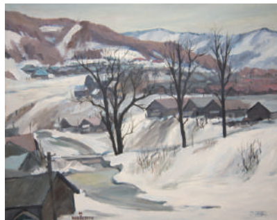
畠山哲雄《冬の川》1978年