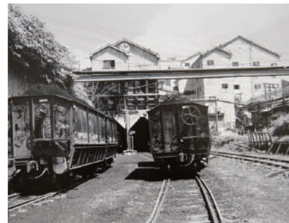
大崎盛《真谷地炭鉱》1987年