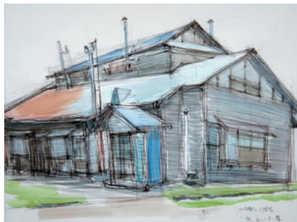
畠山哲雄《山手町の2階家》1994年